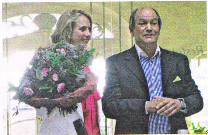
Preis des Pro-Shops 2012.

Ein kaufmännischer Vorstand, ein Leiter des Spiel- und Sportbetriebes und ein Präsident, der repräsentiert, der die Verantwortung für die Außenwirkung des Clubs trägt und dabei die Koordination der internen Bereiche (Sport, Finanzen, Sekretariat, Platzangelegenheiten) überwacht? Zukunftsmusik, aber vielleicht doch eine Diskussion wert! Hier freut sich das Präsidium genauso über Anregungen aus den Reihen der Mitglieder wie bei der Platzerverweiterung. Um zu zeigen, welches Gelände für die Entzerrung des Championship-Course möglicherweise benutzt werden könnte, ist ein Bild aus der Vogelperspektive beigefügt.