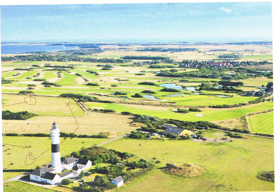
Das Gelände für die mögliche Erweiterung Richtung Kampener Leuchtturm.