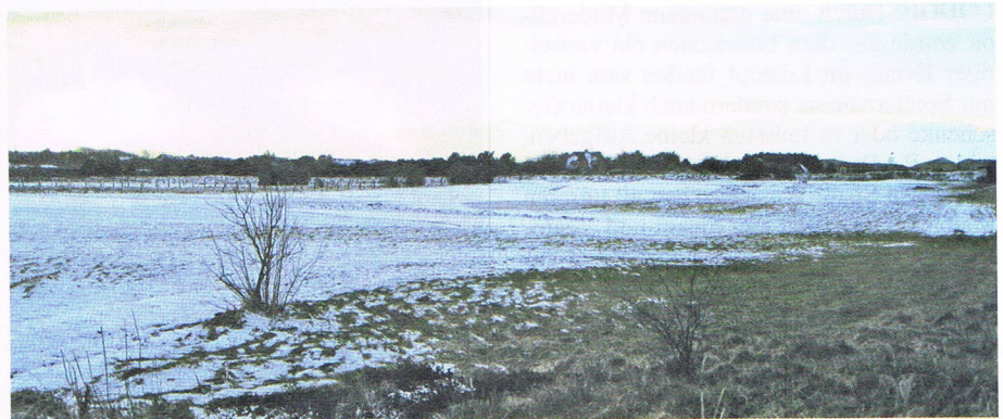
Die neuen Bahnen am Gaadt-Course in der Bauphase.

Es gibt noch keinen Turnierbericht – Schnee bis einschließlich Ostern – aber viele geplante Veranstaltungen, die schon im letzten Jahr besondere Highlights waren. Hierzu zählt zweifellos das von unseren