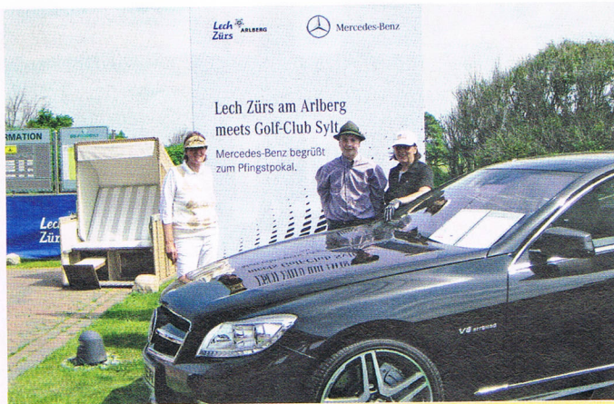
Lech Zürs meets GC Sylt 2012.