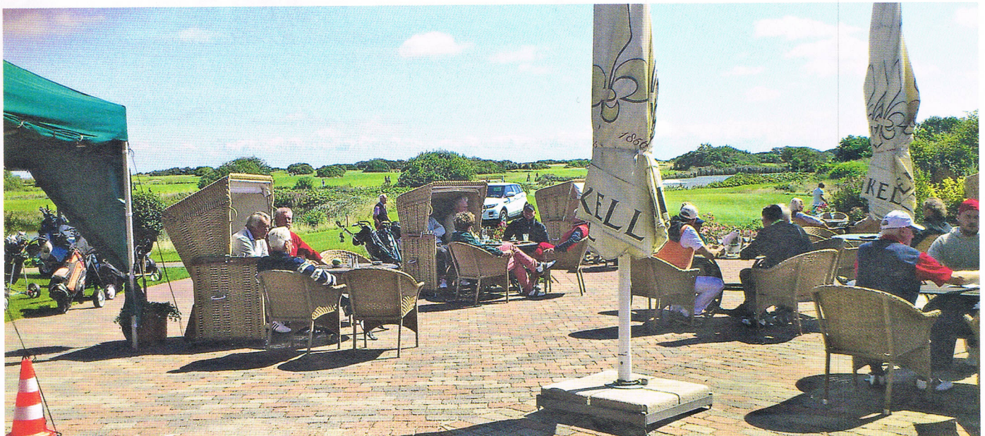
Auf der Terrasse während der SYLT-OPEN 2012.

Genug der Worte – freuen wir uns auf eine sonnige, erfolgreiche und besonders fröhliche Golfsaison 2013!